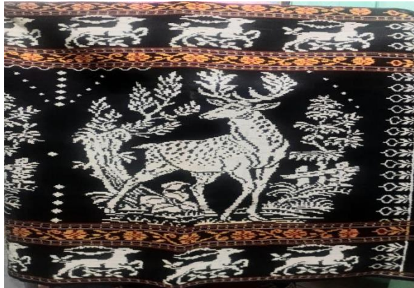
Gambar 3. Motif Rusa ( Ruha )

kosmologi tradisional. Tanduk rusa tersebut melambangkan laki-laki yang tangguh dan kuat sehingga dapat memberikan perlindungan kepada keluarga dengan kekuatan dan keberanian yang dimiliki (Y. Fernandez, 2025). Motif ruha dengan simbolisme pelepasan dan pertumbuhan kembali tanduk, merepresentasikan pemahaman tentang temporalitas yang bersifat kualitatif daripada kuantitatif. Siklus kehidupan yang digambarkan tidak hanya tentang pengulangan mekanis, tetapi tentang pembaruan kreatif yang terus-menerus.