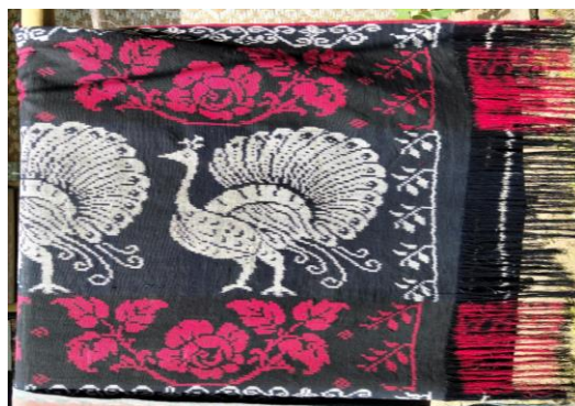
Gambar 1. Motif Merak

Warna-warna cerah pada bulu merak yang direpresentasikan dalam motif tersebut mencerminkan multiplisitas pengalaman spiritual yang dapat dicapai melalui kontemplasi estetik. Motif merak dalam konteks ini berfungsi sebagai objek kontemplasi yang memungkinkan orang untuk beralih dari partikularitas eksistensial menuju universalitas ide. Kain tenun bermotif merak sering digunakan dalam upacara pernikahan. Penggunaan ini tidak hanya untuk hal-hal yang bersifat dekoratif, tetapi juga menciptakan ruang untuk pengalaman estetik yang transformatif.