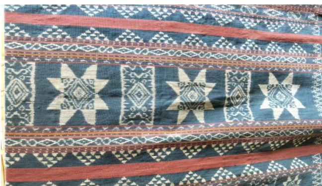
Gambar 2. Motif Dala Mawarani

Motif dala mawarani berarti bintang yang juga diasosiasikan dengan bunga mawar yang melambangkan cahaya dan harapan. Motif ini merujuk pada konsep “jalan yang berbunga,” dalam bahasa daerah Sikka. Motif ini menampilkan pola geometris yang menyerupai labirin dengan elemen-elemen floral yang terintegrasi. Hal ini mencerminkan pemikiran filosofis bahwa kehidupan adalah perjalanan yang penuh dengan keindahan meskipun kompleks dan berliku-liku. Motif dala mawarani juga dipahami sebagai representasi dari bintang fajar yang menyimbolkan kebijaksanaan dan kesucian. Bintang fajar itu memberikan penerangan, petunjuk serta menjadi sarana untuk menangkal malapetaka (Epo & Maulina, 2024).