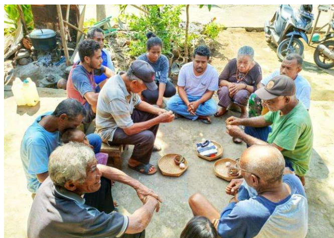
Gambar 3. Proses ritual Soga Madak