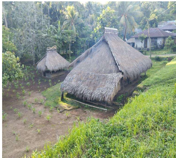
Gambar 2. Rumah Adat di Adonara