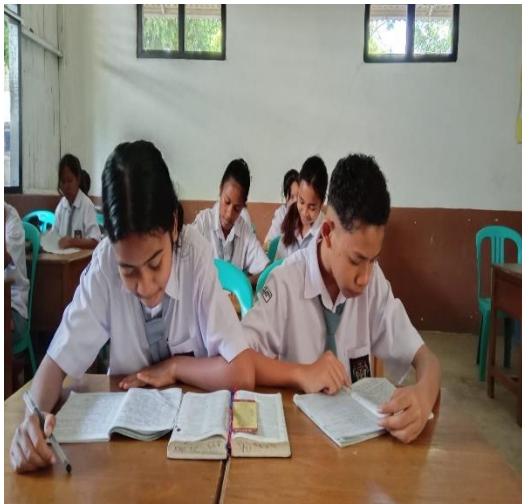
Pertemuan 3 (Siklus I)