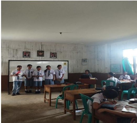
Pertemuan 1 (Siklus I)