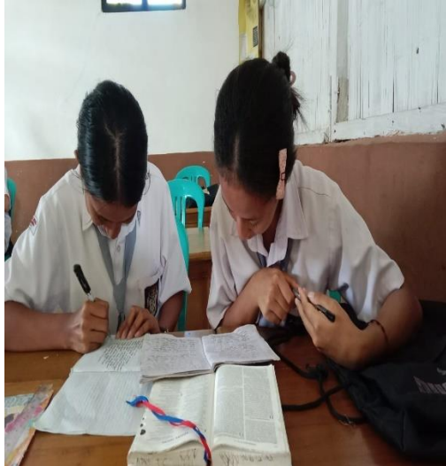
Pertemuan 3 (Siklus II)