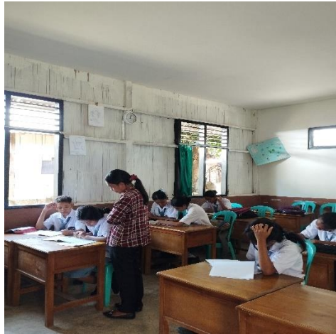
Pertemuan 2 (Siklus I)