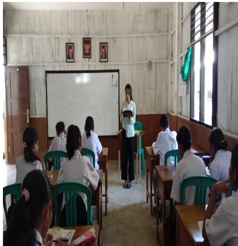
Pertemuan 1 (Siklus II)