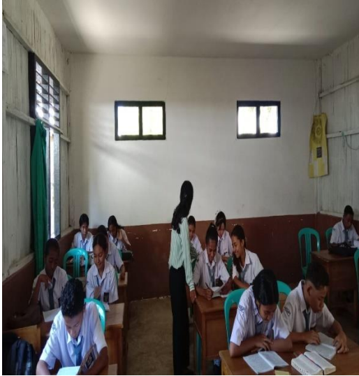
Pertemuan 2 (Siklus II)