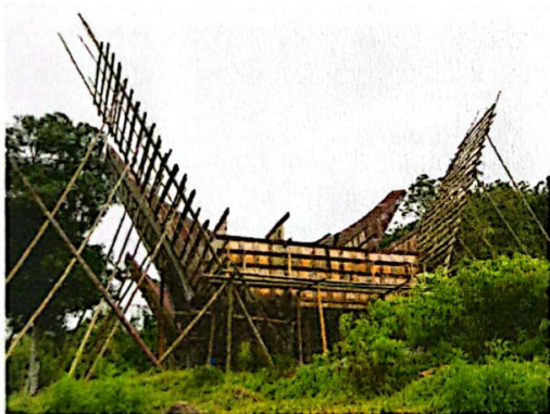
Gambar 2. Pembangunan Tongkonan