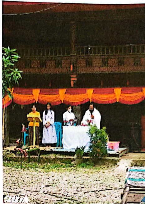
Gambar 5. Upacara Pemberkatan Rumah