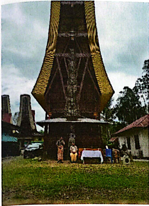
Gambar 4. Syukuran atas Selesaiya Pembangunan Tongkonan