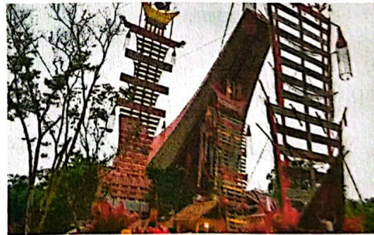
Gambar 3. Mbate sebagai Tanda Dimulainya Upacara Penahbisan Rumah