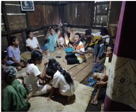
FOTO-FOTO KEGIATAN OMK