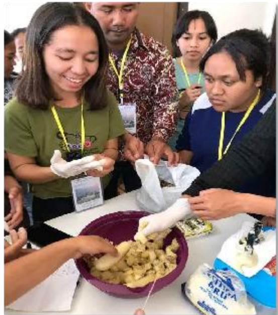
Beberapa OMK sedang mengikuti pelatihan pembuatan Rosario dan makanan olahan pangan lokal