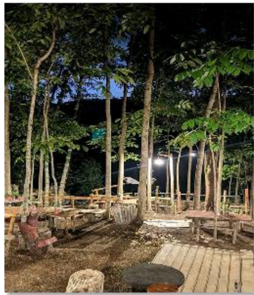
View Pontala's cafe pada malam hari. Tempat untuk berdiskusi, rekreasi, pertemuan semi formal, spot foto dan aneka kegiatan lain.