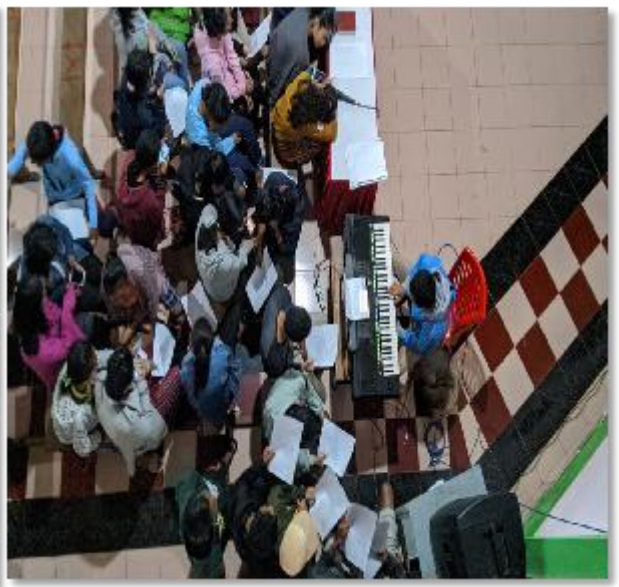
OMK menjadi petugas liturgi Paduan Suara dalam beberapa Perayaan Ekaristi