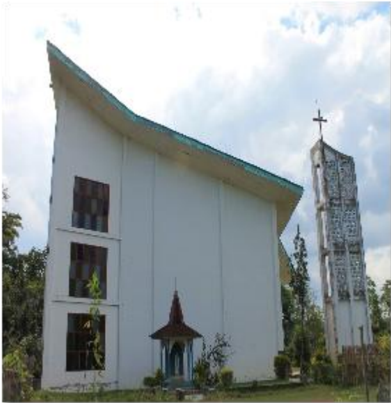
Tampak luar gereja Paroki Roh Kudus Timung