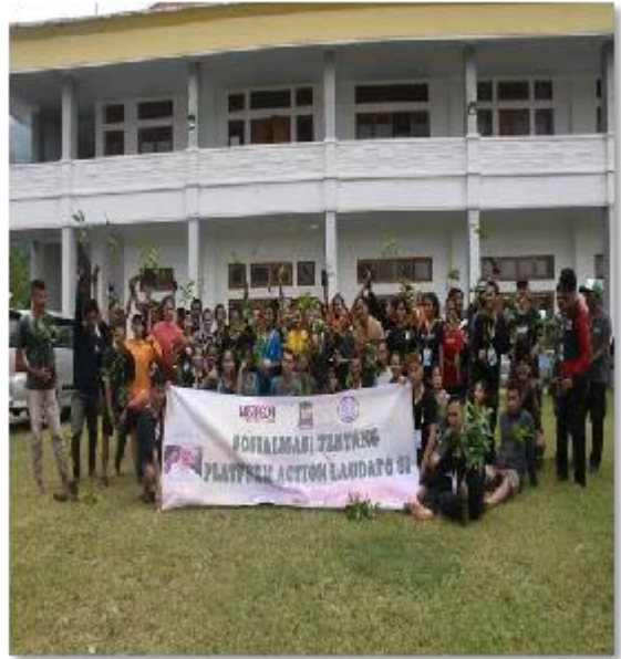
Beberapa OMK mengikuti kegiatan bersama KomkepKeuskupan Ruteng