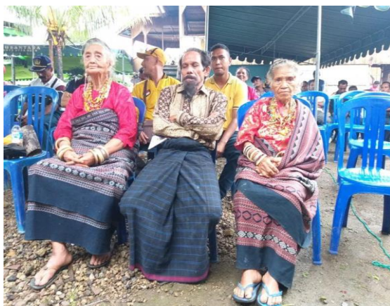
(Para Pemuka Adat Du'a Mo'an Watu Pitu )