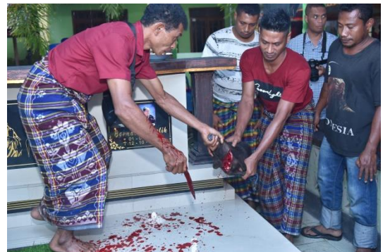
(Pemimpin ritus menyambelih babi kecil dan darahnya ditetaskan di atas makam)