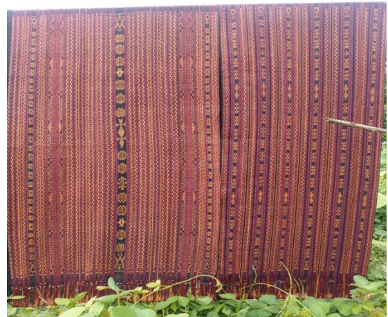
(Sarung adat Hewokloang- Utan Welak )