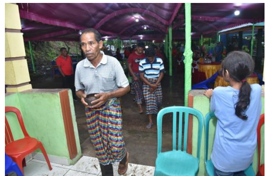
(Pelaksanaan ritus wake 'loe dan penyerahan patan 'loe , kemudian arwah diajak masuk rumah)