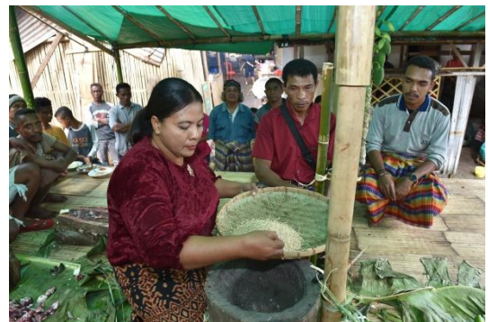
(Ritus wai pare oleh A'a Wine )