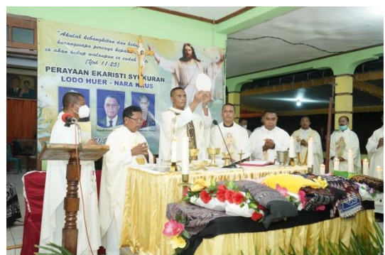
(Tam undangan dan seluruh anggota keluarga dengan khidmat mengikuti Ekaristi Nara Krus)