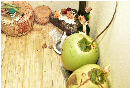
(Batu Sesajian- Watu Mahang )