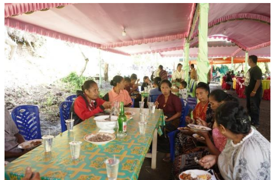
(Tradisi pembagian Hewan Kurban kepada seluruh anggota keluarga klan)