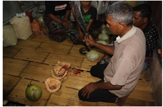
(Ritus menyalakan Suluh untuk mengiringi arwah menuju tempat yang terang)