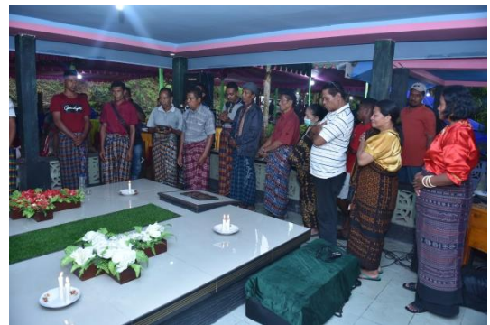
(Ritus tanam Salib- Pa'at Krus )