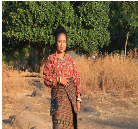
(Pakaian adat kebesaran wanita Hewokloang)