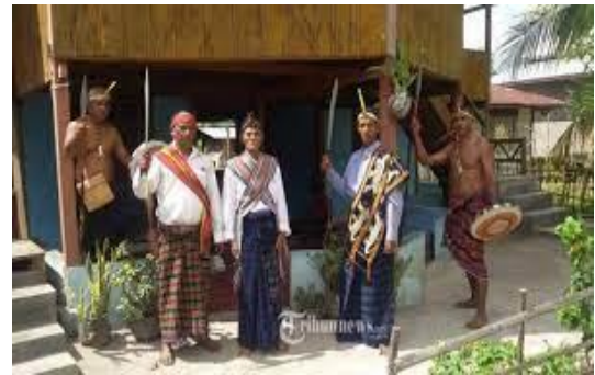
(Tetua Adat Hewokloang, di depan Lepo Baoblutuk)