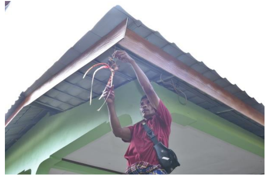
(ritus tokang Nuhun dan lor koli wojong)