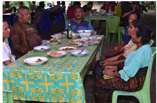
(Peristiwa makan bersama- Ea Gete di dalam rumah pesta)