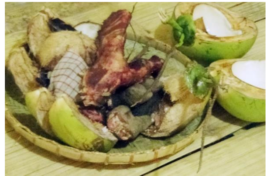
(Perlengkapan untuk ritus Lodo )