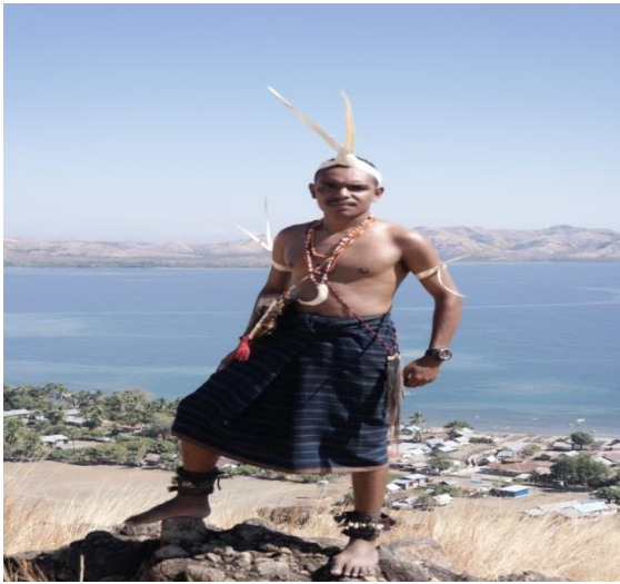
(Pakaian adat kebesaran pria Hewokloang)