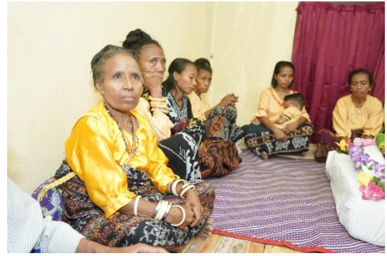
(Kebiasaan Tuguran atau Nara Krus diselingi dengan ratapan dan syair Leke )