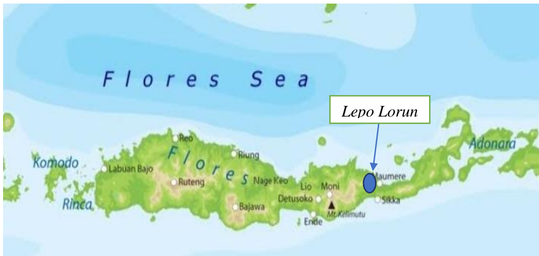
Peta 1: Pulau Flores