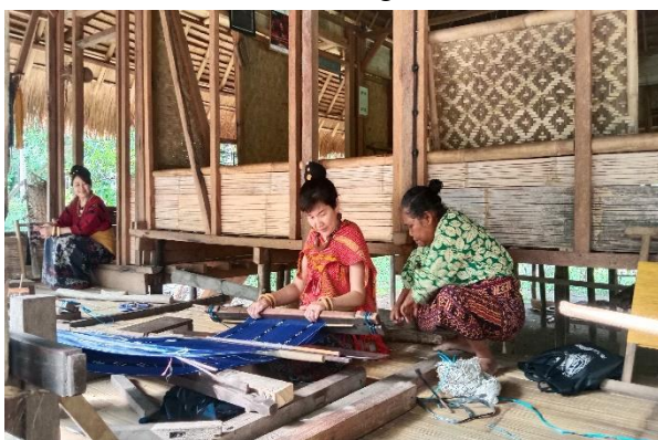
Foto 5: Area Tenun di Lepo Gete