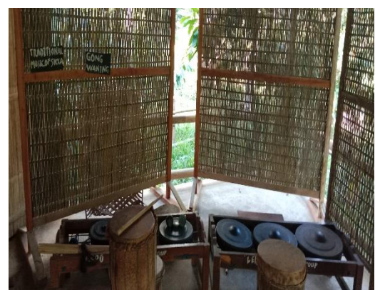
Foto 6: Alat Musik Gong Waning.