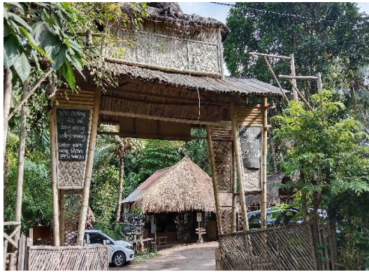
Foto 1: Pintu Masuk Lepo Lorun.