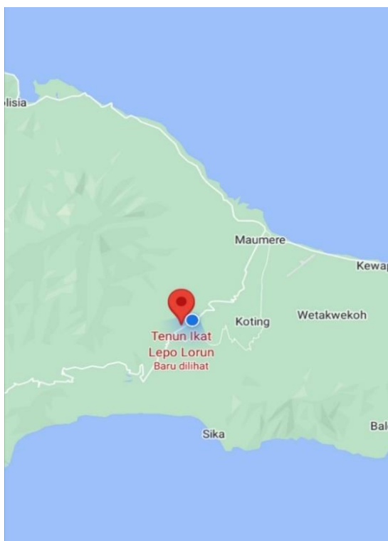
Peta 2: Kabupaten Sikka