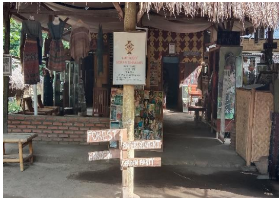
Foto 3: Area Tamu Lepo Lorun.