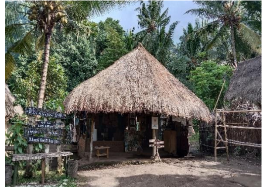
Foto 2: Tampak Depan Lepo Lorun (16-02-2023)