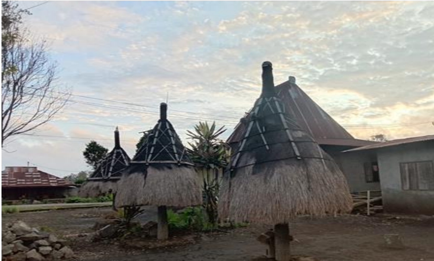
(Keterangan: Ngadhu dan bhaga yang berada di kampung Bo Soba)