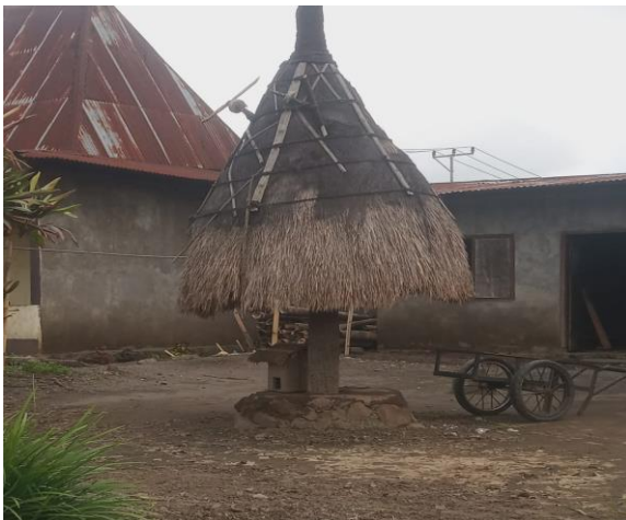
(Keterangan: Ngadhu Wuda dan Bhaga Bupu Ine Renge )