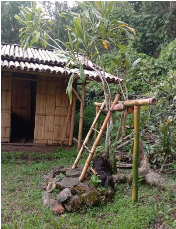
(Keterangan: Tampak samping Loka Tiwu Meze )