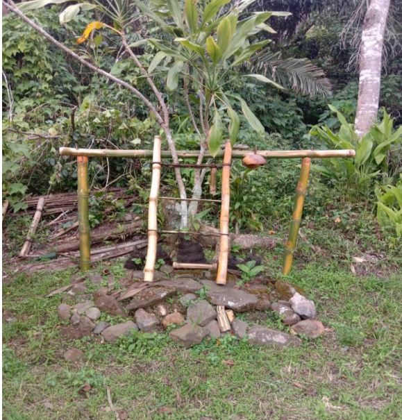
(Keterangan: Tampak depan Loka Tiwu Meze )