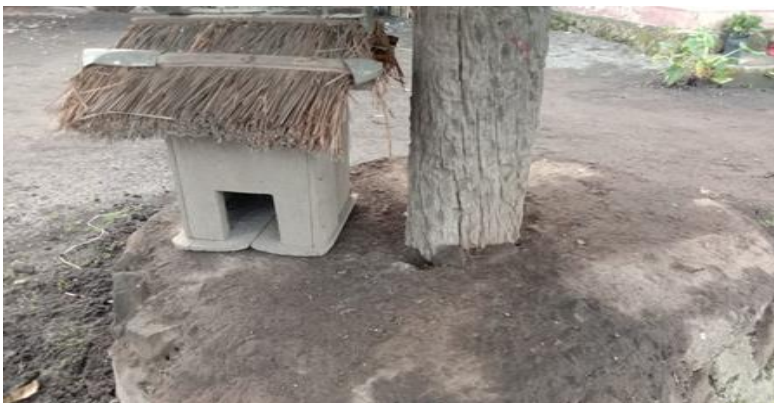
(Keterangan: Penampakan Tiang korban Ngadhu Wuda dan Bhaga Bupu Ine Renge )