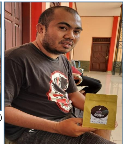
Ket. Foto: Gonsales Siga (OMK) dengan produk Kopi KOMET kemasan