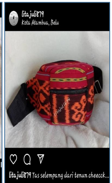
Ket. Foto: Media Sosial Instagram sarana penjualan produk ekonomi kreatif Pascuela Rosa de Fatima