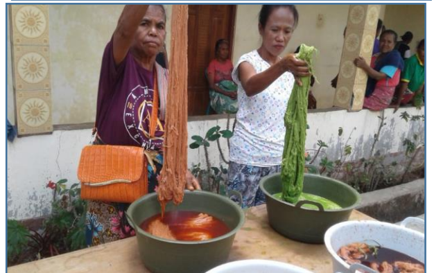
Ket. Foto: Kegiatan pelatihan pewarnaan benang oleh Komisi PSE Keuskupan Atambua bagi kelompok tenun ikat di Paroki St. Yohanes Pemandi Haliwen