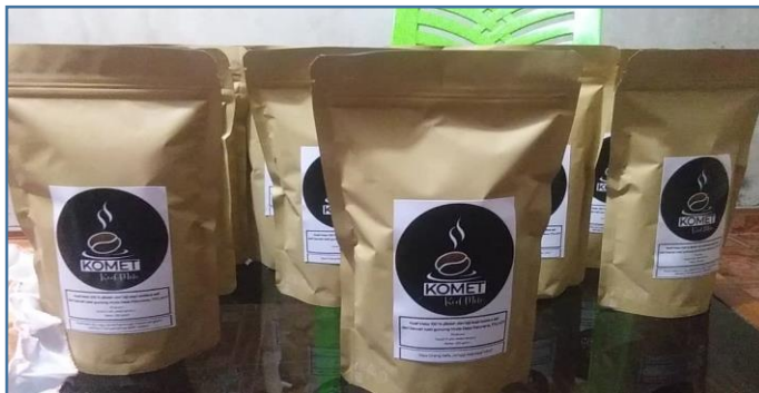
Ket. Foto: Produk Kopi KOMET kemasan (250 gram)