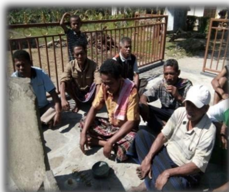
Foto 7. Ritus Pemisahan di Menhir