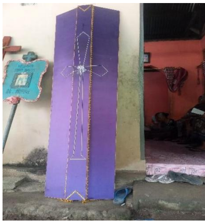
Foto. 3. Mein peti jenazah