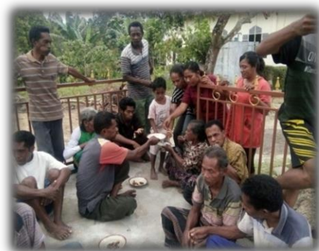
Foto. 4. Ritus lodo huer di menhir