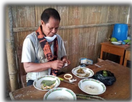
Foto 8. Persiapan alat dan bahan ritus