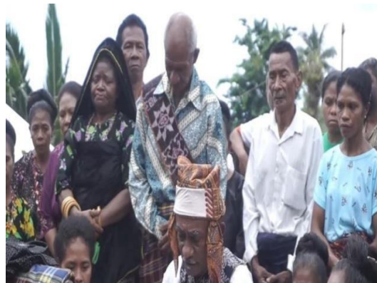
Foto 14. Ritus lodo di mahe/menhir