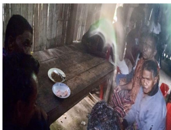
Foto 15. Persiapan pelaksanaan adat hegong