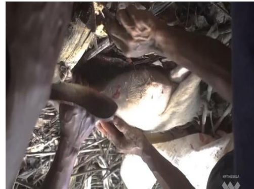
Foto. 15. Penyembelihan hewan kurban