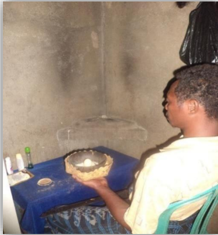
Foto: Pemberia sesajian