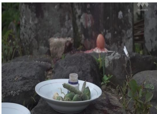
Foto 10. Sirih pinang dan telur