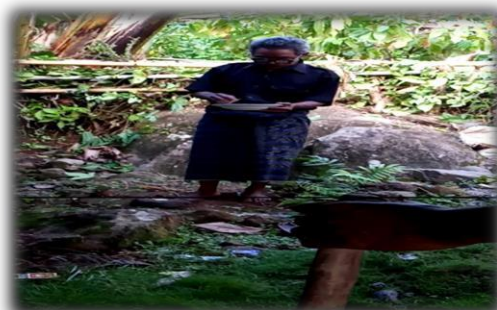
Foto 9. Ritus panggilan liang lahat