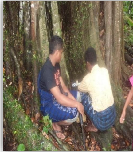
Foto. 2. Ritus di ai tali