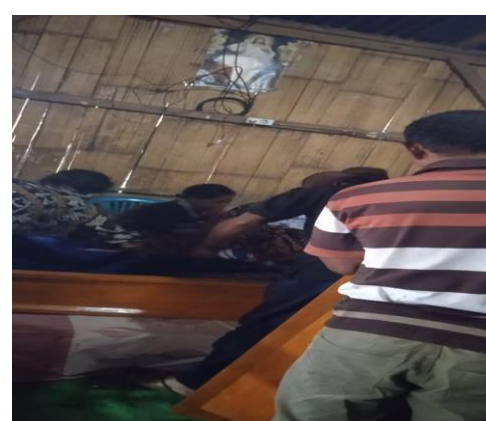
Foto. 16. Persiapan penutupan peti Jenazah