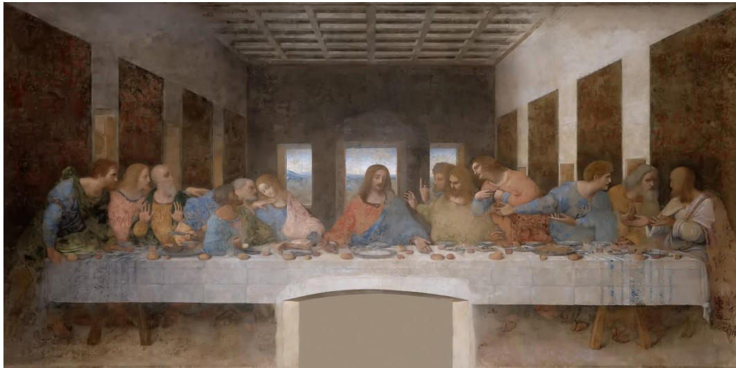
Gambar 1. Lukisan asli The Last Supper di Biara Santa Maria delle Grazie- Milan.