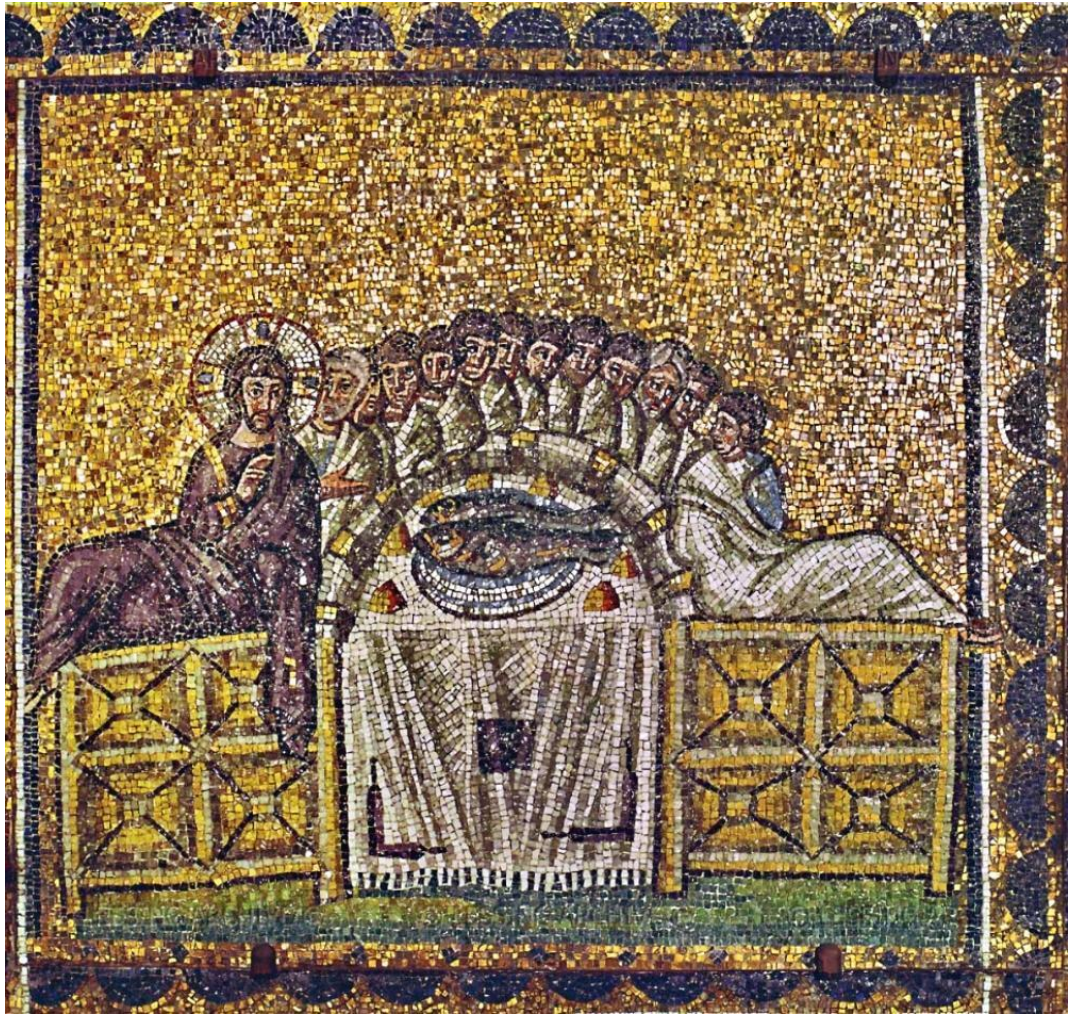
Gambar 4. Mosaik Perjamuan Terakhir dari Basilika Sant' Apollinare Nuovo di Ravenna: salah satu gambar perjamuan terakhir tertua. Lukisan ini dibuat pada paruh abad kelima.

Gambar diambil dari https://05varvara.files.wordpress.com/