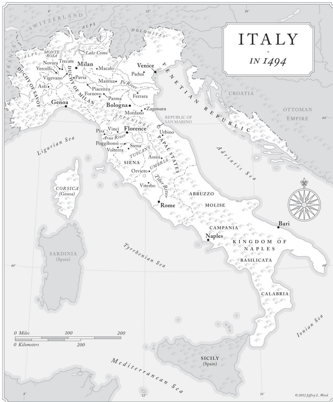
Gambar 3. Peta Italia pada tahun 1494, zaman di mana Leonardo hidup.

Gambar diambil dari buku Leonardo and The Last Supper oleh Ross King (New York: Walker & Company, 2012).