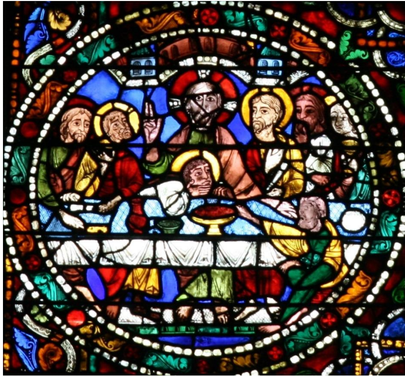
Gambar 5. Ukiran Perjamuan Terakhir pada kaca patri di Katedral Chartres- Paris