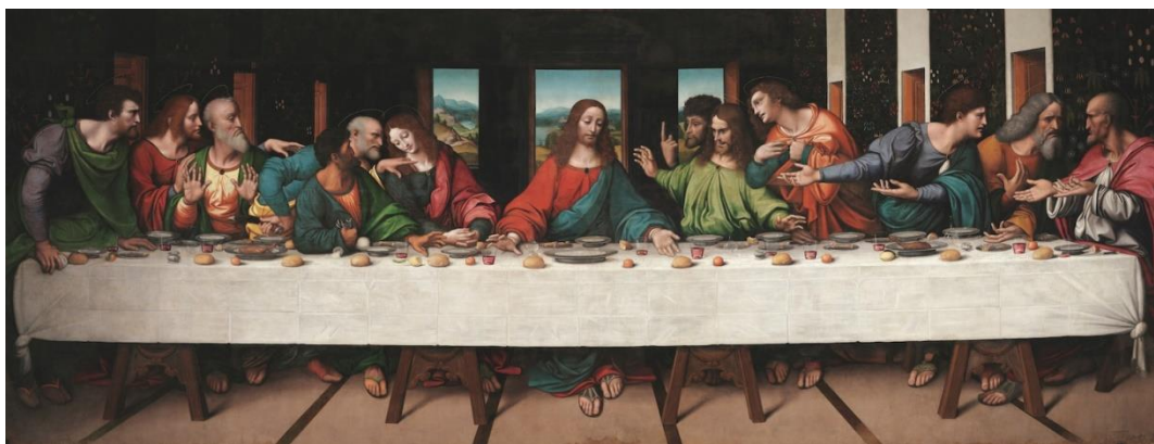
Gambar 2. Detail terbaru lukisan The Last Supper karya Leonardo da Vinci yang direstorasi secara digital.